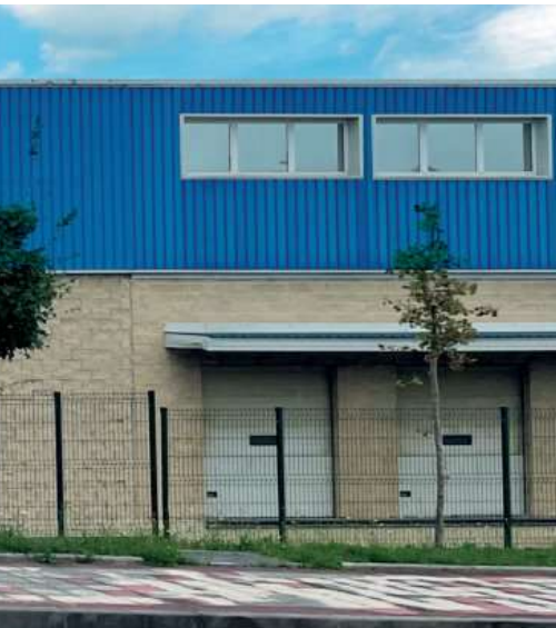
La factoría de Lezama será 0 Emisiones Netas, 0 Fugas y 0 Residuos.